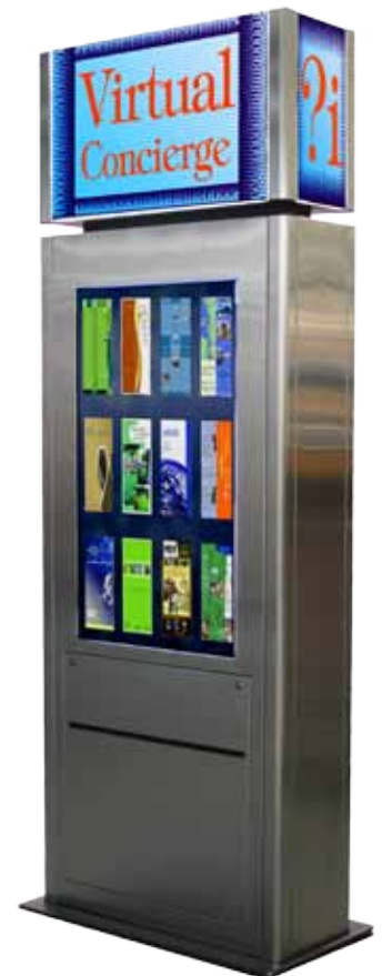
Aveta Portero Virtual